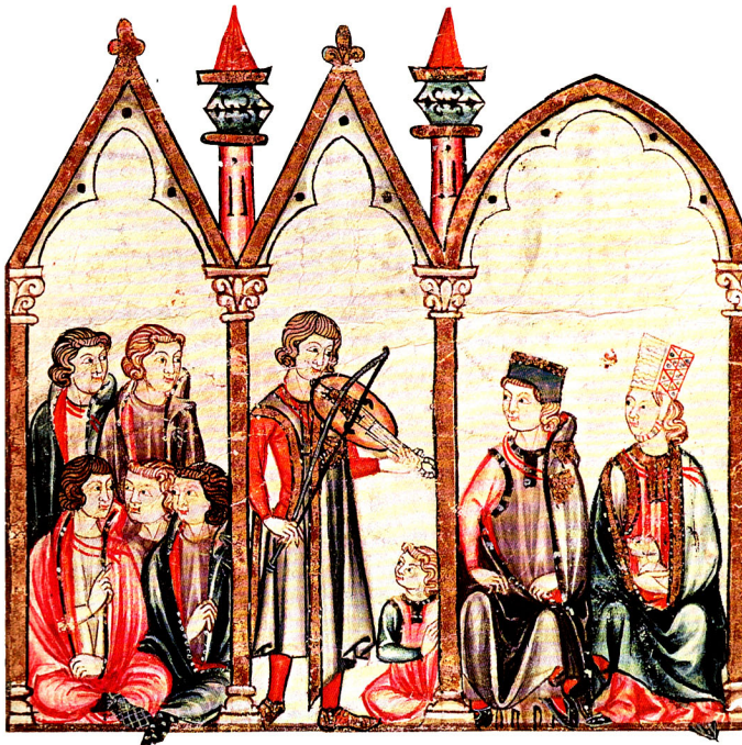
Groupe de troubadours (illustration du XIII e siècle).