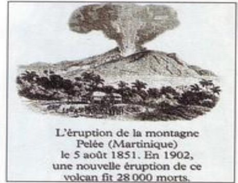
L'éruption de la montagne Pelée (Martinique) le 5 août 1851. En 1902, une nouvelle éruption de ce volcan fit 28 000 morts.

De grosses coulées de lave détruisent tout sur leur passage – comme ce village qui se dressait autrefois au bout de cette route, près du volcan du mont Kilauea, à Hawaii.