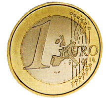
Doc. 2 : Une pièce de 1 euro.

? Quels sont les éléments représentés sur la face de cette pièce (Doc. 2) ?