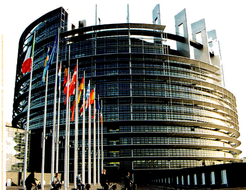
Doc. 3 : Le siège du Parlement européen à Strasbourg (France).

Dès 1945, quelques pays européens (dont la France et l'Allemagne), ruinés par la Seconde Guerre mondiale, pensent à s'unir pour se reconstruire et établir une paix durable. En 1957, six pays (la Belgique, la France, l'Italie, le Luxembourg, les Pays-Bas et la République fédérale d'Allemagne) signent le traité de Rome. Ils créent la Communauté économique européenne (CEE, (Doc. 1)) qui doit faciliter les échanges entre leurs pays. En 1992, la CEE devient l'Union européenne (UE). Elle réunit alors 12 pays. Depuis, elle a continué de s'élargir (Doc. 1). Aujourd'hui, elle compte 25 pays membres.