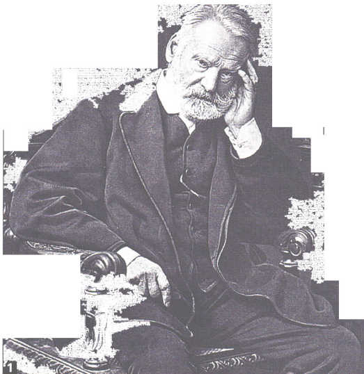
Un grand écrivain : Victor Hugo (1802-1885) est l'auteur du célèbre roman Les Misérables .