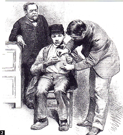
Joseph Meister a 9 ans. Il a été mordu par un chien enragé et on pense qu'il va mourir. Du 6 au 16 juillet 1885, Louis Pasteur lui prescrit douze vaccins contre la rage. Finalement, Joseph Meister guérit : Pasteur (derrière) a donc prouvé l'efficacité de son vaccin.