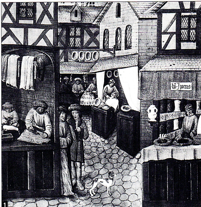
Une rue commerçante au Moyen Âge

À partir du 12 e siècle, les villes se développent. Elles sont entourées de remparts pour leur défense. Les rues étroites, souvent sales, sont très animées autour des boutiques, des églises et de l'hôtel de ville avec son beffroi*. Les maisons sont le plus souvent construites en bois. Malgré le couvre-feu* du soir, de violents incendies ravagent les villes. Quand ils commencent, les guetteurs dans les beffrois sonnent le tocsin*. Les habitants craignent les épidémies (peste, choléra) dues au manque d'hygiène, ainsi que les inondations.