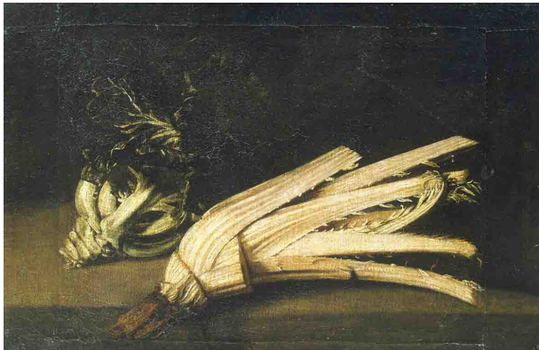
Nature morte au cardon et au chou , école espagnole du XVII e siècle, huile sur toile, musée des beaux-arts et d'archéologie de Besançon.