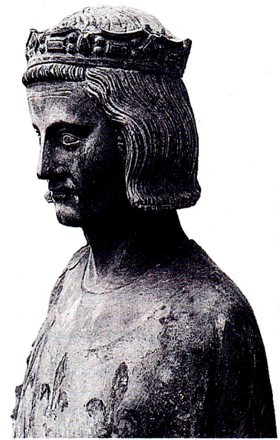
2 Saint Louis