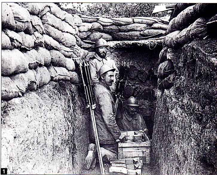
Soldats dans les tranchées 1

Le traité de paix est signé à Versailles en juin 1919. L'Allemagne rend l'Alsace et la Lorraine à la France.