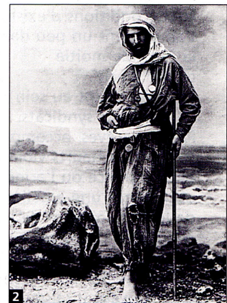
Savorgnan de Brazza (1852-1905) est un célèbre explorateur qui mena plusieurs expéditions au Congo.