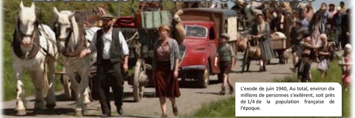
L'exode de juin 1940, Au total, environ dix millions de personnes s'exilèrent, soit près de 1/4 de la population française de l'époque.