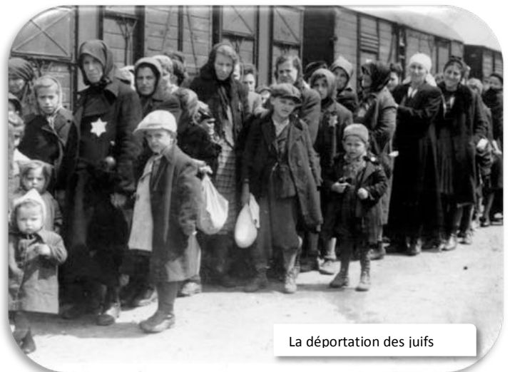
La déportation des juifs