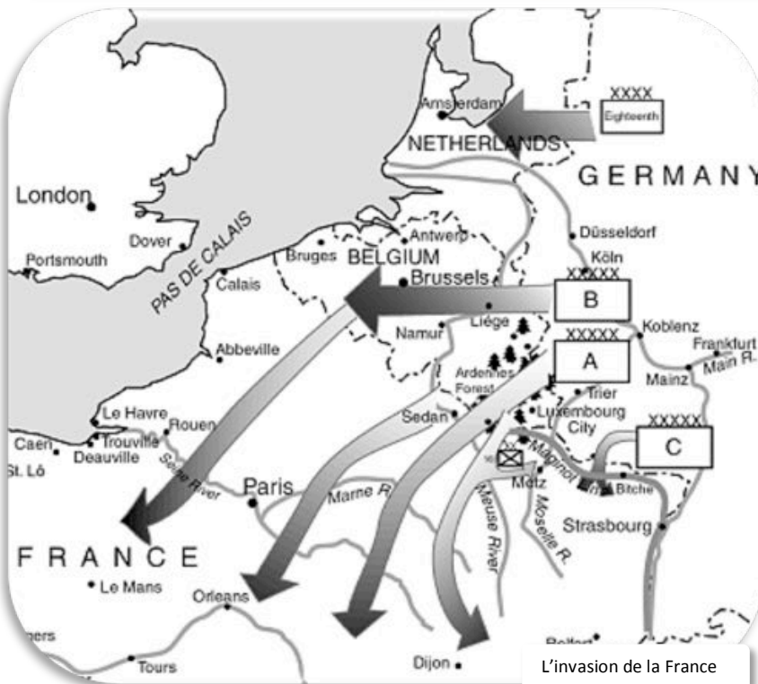
L'invasion de la France

Le 10 mai 1940, brusquement, Hitler ....., par la Hollande et la Belgique . Une armée française qui s'était portée à la rencontre des Allemands recula, harcelée par des centaines d'avions et de chars. Une partie fut encerclée; 300 000 Anglais et Français réussirent à s'embarquer à.....; malheureusement presque tout le matériel fut abandonné.