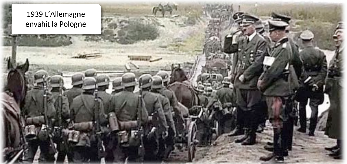
1939 L'Allemagne envahit la Pologne

en trois semaines, la Pologne fut anéantie.