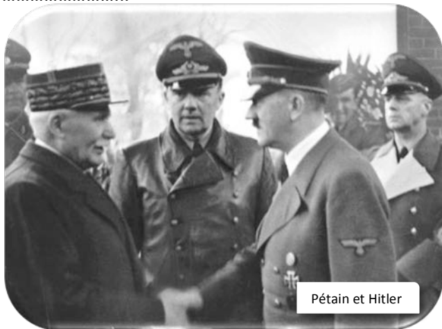
Pétain et Hitler