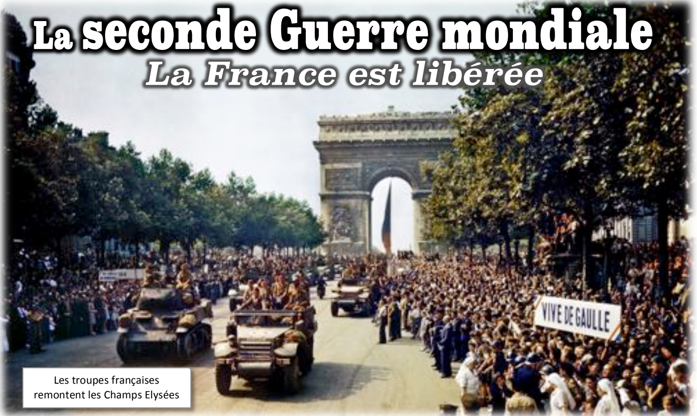
Les troupes françaises remontent les Champs Elysées

La libération de Paris a eu lieu en août 1944, marquant ainsi la fin de la bataille de Normandie. Cet épisode met fin à quatre années d'occupation de la capitale française.