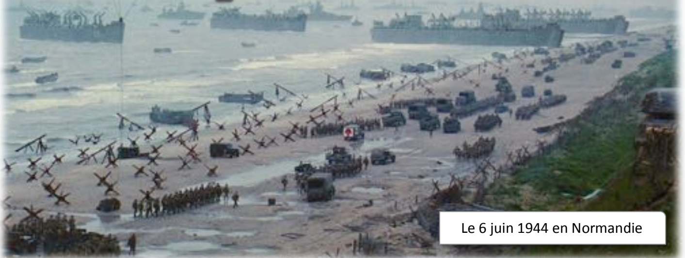
Le 6 juin 1944 en Normandie

....., les armées alliées, sous le commandement du général Eisenhower, réussissent à débarquer sur les côtes de ..... entre Cherbourg et le Havre, malgré les formidables remparts de béton appelés par les Allemands le «.....».