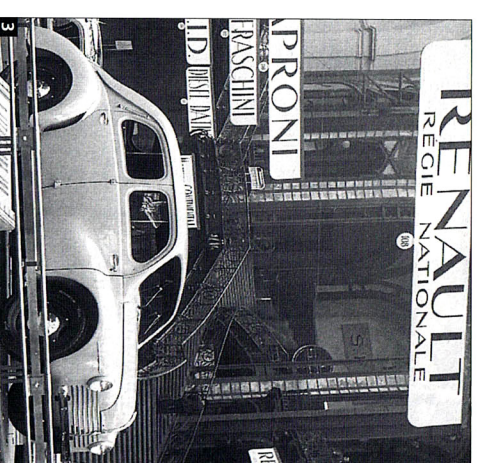
3 La 4 CV Renault présentée au Salon de l'automobile de 1946. Très populaire, cette voiture sera vendue à plus d'un million d'exemplaires.

115 V (vrai) ou F (faux) après chaque phrase.