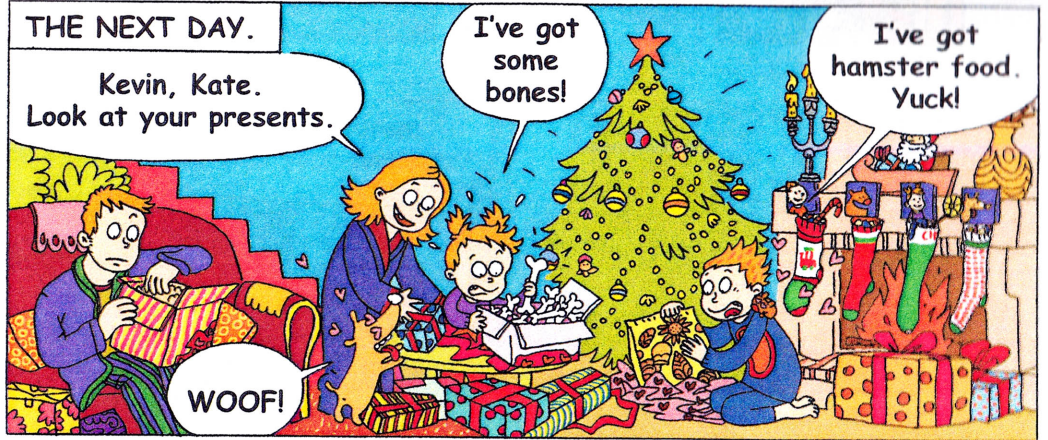
Le lendemain. - Kevin, Kate. Regardez vos cadeaux.