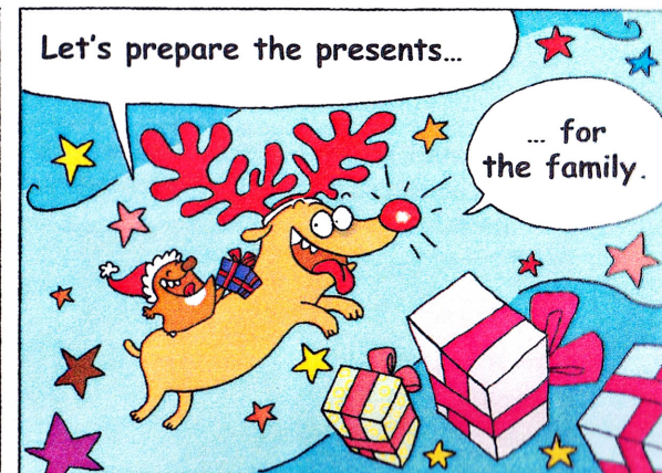
- Préparons les cadeaux...