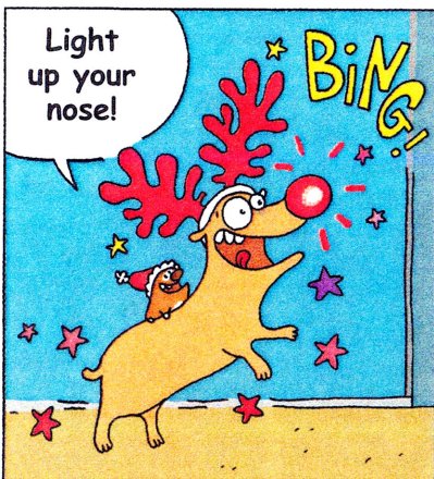
- Allume ton nez!