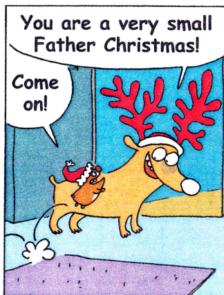
- Tu es un tout petit Père Noël!! - Allons-y!