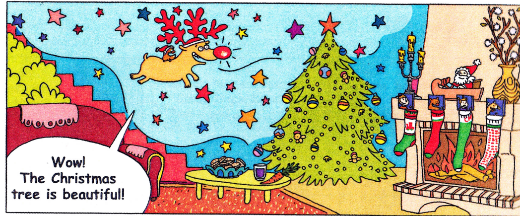
- Waouh! L'arbre de Noël est magnifique!