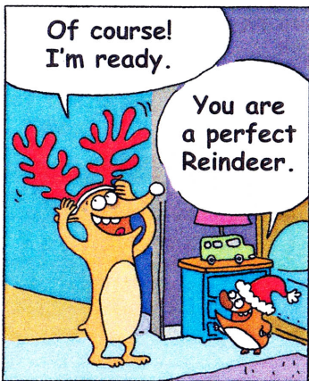
- Bien sûr! Je suis prêt. - Tu es un renne parfait.