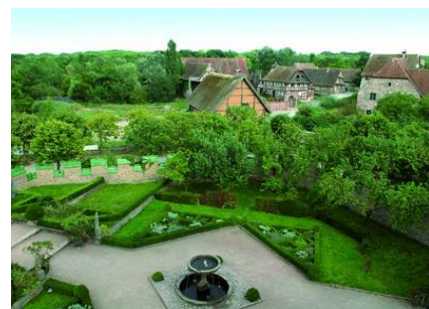
Les jardins du donjon