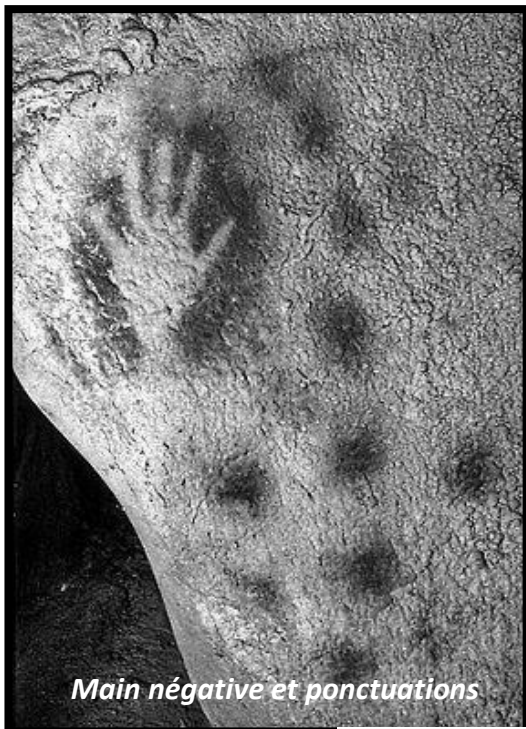
Main négative et ponctuations

Cette petite tête en ivoire, d'à peine quatre centimètres de hauteur a été découverte par Edouard Piette en 1894 à l'entrée de la grotte du Pape à Brassempouy dans les Landes. Elle a été sculptée au gravettien (vers 29000 / 22000 av. J.-C.), période du paléolithique supérieur qui voit l'éclosion de nouvelles formes artistiques : des pierres, de l'argile, des os ou des bois de rennes sont gravés, des cavernes sont ornées de chevaux peints ou d'empreintes de mains au pochoir. C'est notamment à cette époque que remontent les premières représentations de l'homme : la Dame de Brassempouy est l'une des plus anciennes que l'on conserve. La Dame de Brassempouy a été taillée dans de l'ivoire de mammouth. Elle est considérée comme un chef-d'œuvre de l'art mobilier paléolithique.