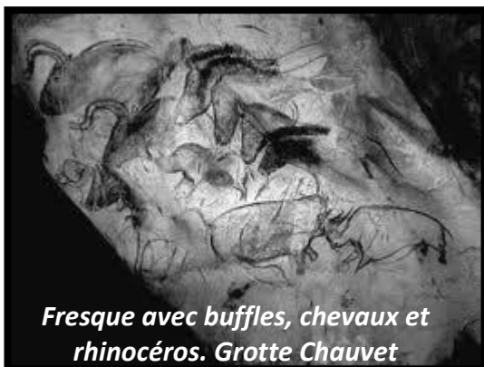
Fresque avec buffles, chevaux et rhinocéros. Grotte Chauvet