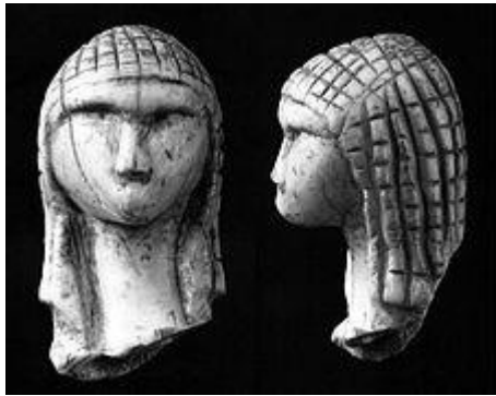
Dame de Brassempouy Dame à la capuche

Cette petite tête en ivoire, d'à peine quatre centimètres de hauteur a été découverte par Edouard Piette en 1894 à l'entrée de la grotte du Pape à Brassempouy dans les Landes. Elle a été sculptée au gravettien (vers 29000 / 22000 av. J.-C.), période du paléolithique supérieur qui voit l'éclosion de nouvelles formes artistiques : des pierres, de l'argile, des os ou des bois de rennes sont gravés, des cavernes sont ornées de chevaux peints ou d'empreintes de mains au pochoir. C'est notamment à cette époque que remontent les premières représentations de l'homme : la Dame de Brassempouy est l'une des plus anciennes que l'on conserve. La Dame de Brassempouy a été taillée dans de l'ivoire de mammouth. Elle est considérée comme un chef-d'œuvre de l'art mobilier paléolithique.