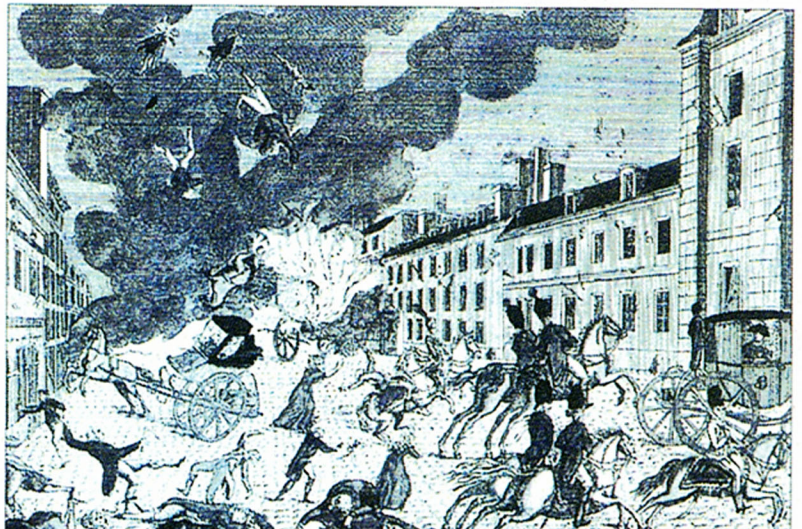
Le soir de Noël 1800, une machine infernale explose à Paris, rue Saint-Nicaise. Le consul Bonaparte, qui est visé.

Cela prouve que certaines personnes sont opposées à Napoléon et veulent sa mort.